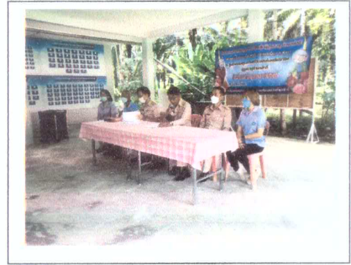
นายกอบต.ลำภีกกล่าวเปิดงาน