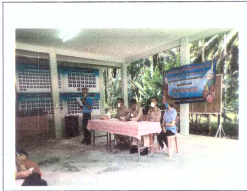
ประธานชมรมผู้สูงอายุกล่าวเปิดรายงาน