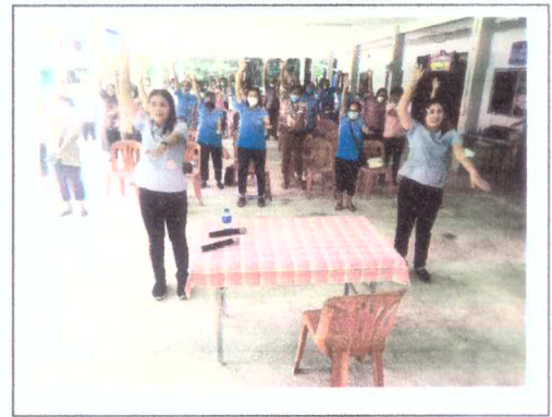
นวก.ทันตกรรมโรงพยาบาลส่งเสริมสุขภาพตำบลลำภีกให้ความรู้เรื่องการดูแลสุขภาพช่องปากผู้สูงอายุ